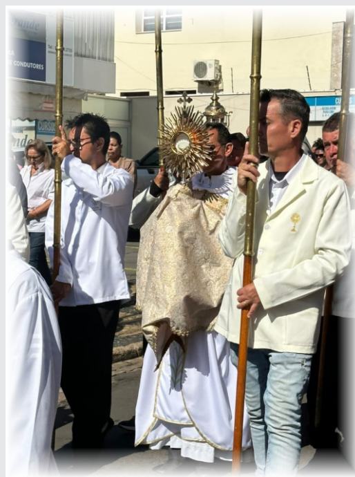
Participação na Celebração de Corpus Christi