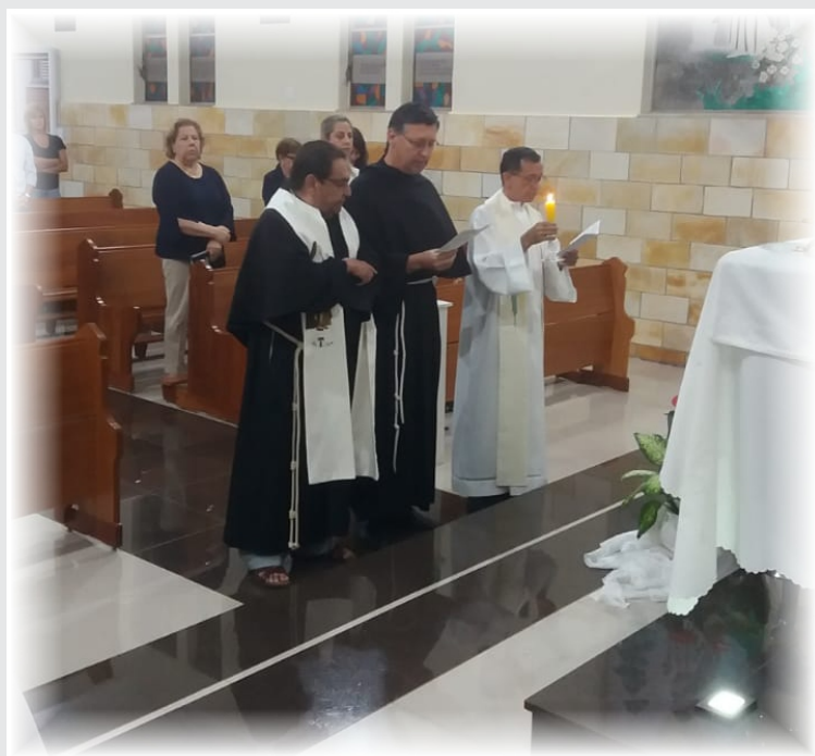
Renovação dos Votos