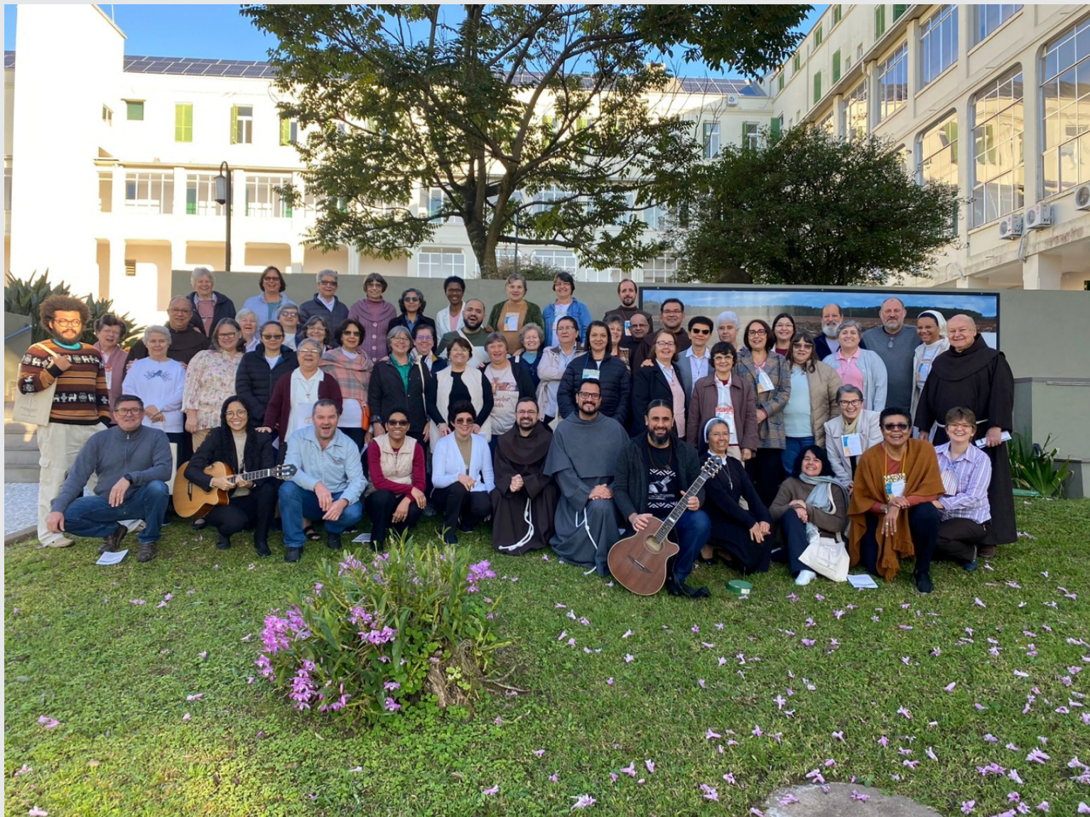
FOTO OFICIAL DA XIX AGO DA CFFB